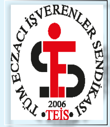
SENDİKAMIZDAN HABERLER (9-10)