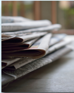
BASINDA TEİS (16-19)