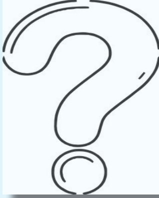
ECZACILAR NE DÜŞÜNÜYOR (11-13)