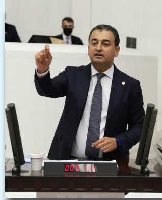
ECZ. BURHANETTİN BULUT ADANA MİLLETVEKİLİ (14-15)